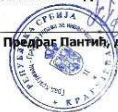
Предраг Пантић, дипл.економиста