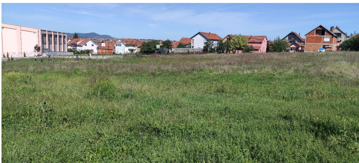
Slika 5 - Prikaz lokacije na kojoj je planirana izgradnja objekta