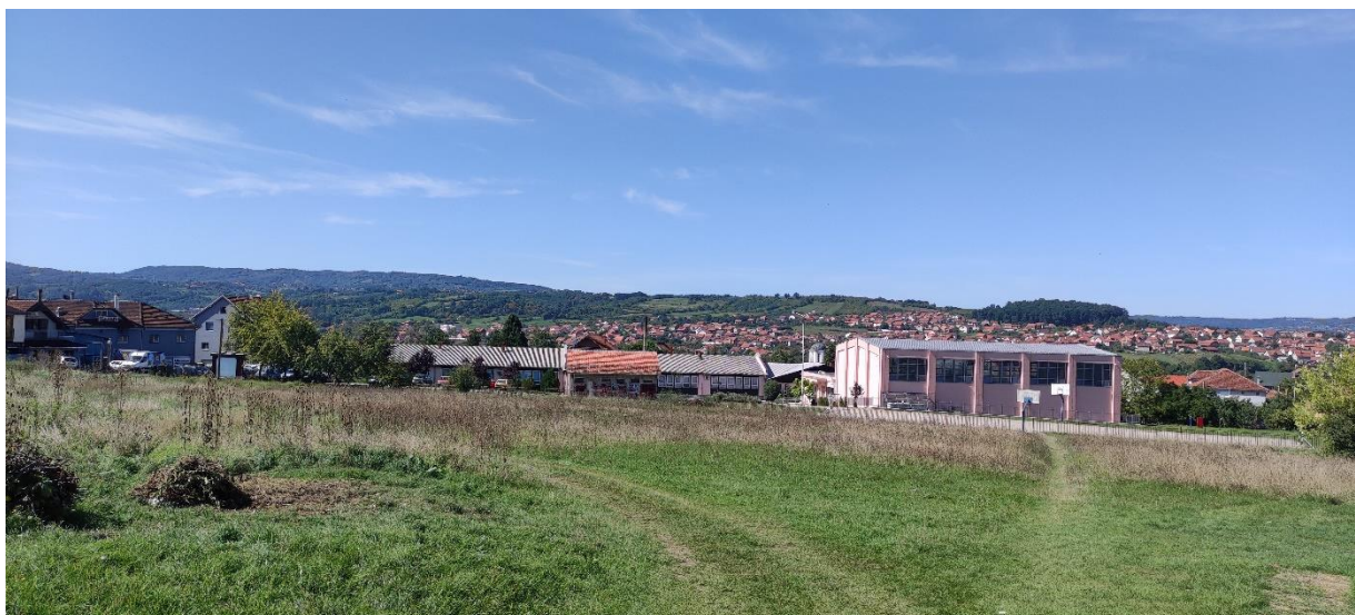
Slika 4 - Prikaz lokacije na kojoj je planirana izgradnja objekta