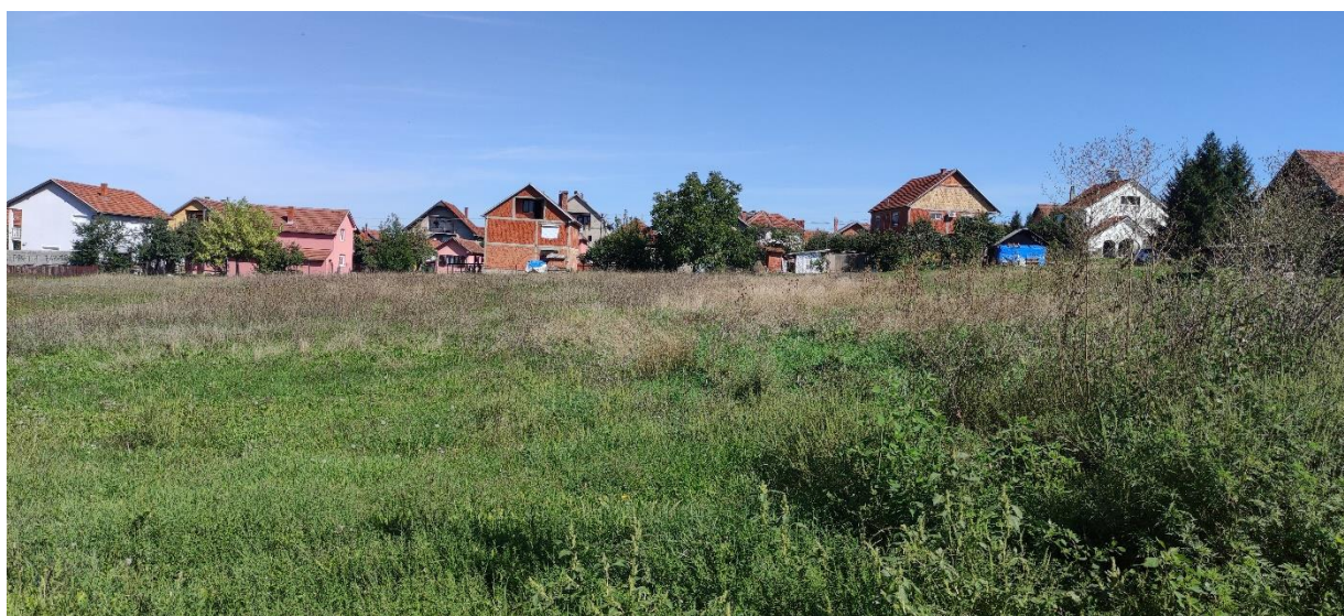
Slika 3 - Prikaz lokacije na kojoj je planirana izgradnja objekta