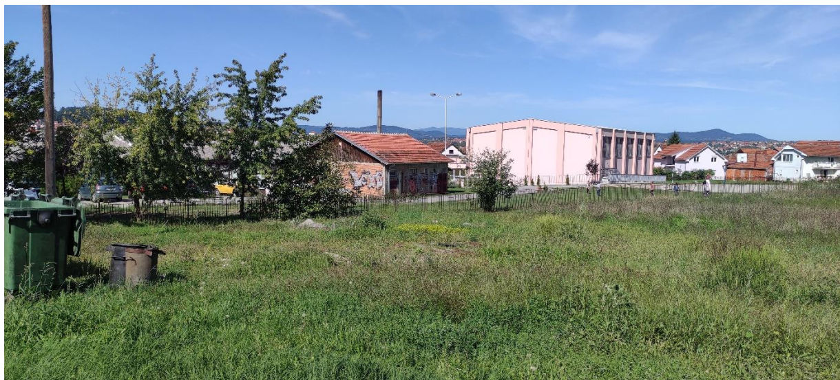
Slika 2 - Prikaz lokacije na kojoj je planirana izgradnja objekta

Ovim PzUŽSSO razmatra se izgradnja novog objekta kao intervencija planirana ovim potprojektom.